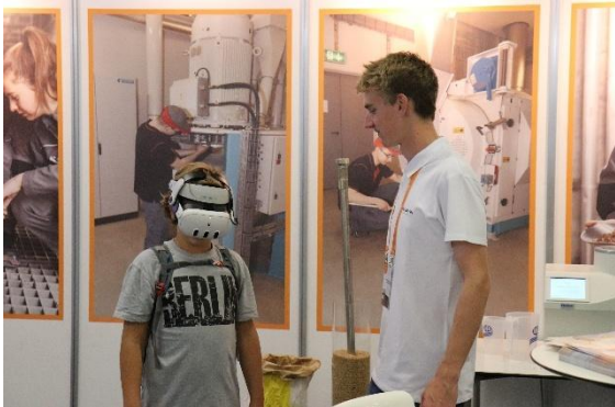
VAM-Stand an den SwissSkills 2025 in Bern

Der VAM organisiert die jährliche Delegiertenversammlung, die Präsentation des Müllerberufs an den SwissSkills , überbetriebliche Kurse und engagiert sich auch beim Leistungswettbewerb «MühlenMasters» für Nachwuchsmüller aus Deutschland, Österreich und der Schweiz.