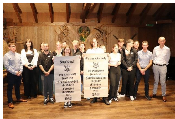
Abschlussfeier 2025 der deutschsprachigen Absolvent/-innen in Sempach

17 Lernende schlossen erfolgreich ab (10 Lebensmittel / 7 Futtermittel).