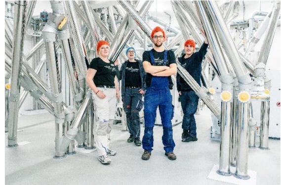
Die Gewinner des MühlenMasters in Griesskirchen (AT)

Der VAM sorgt damit für die kontinuierliche Qualität und Weiterentwicklung des Müllerberufs und stärkt die Verbindung von Tradition, Handwerk und moderner Technologie in beiden Fachrichtungen – Lebensmittel und Futtermittel.